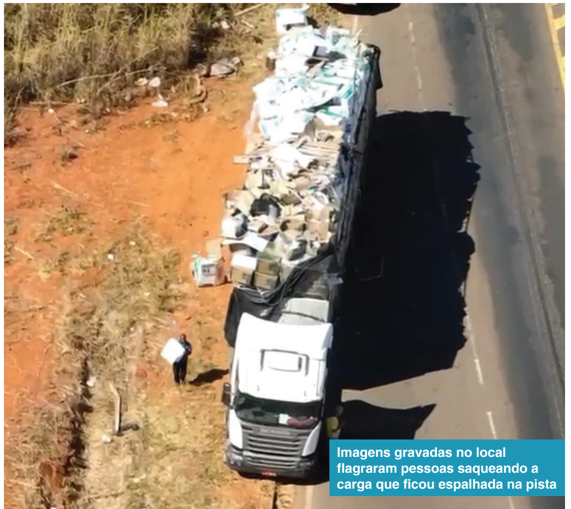
Imagens gravadas no local flagraram pessoas saqueando a carga que ficou espalhada na pista